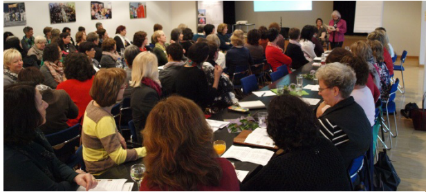
Eine grosse Zuhörerschaft am Infotag in Lenzburg.