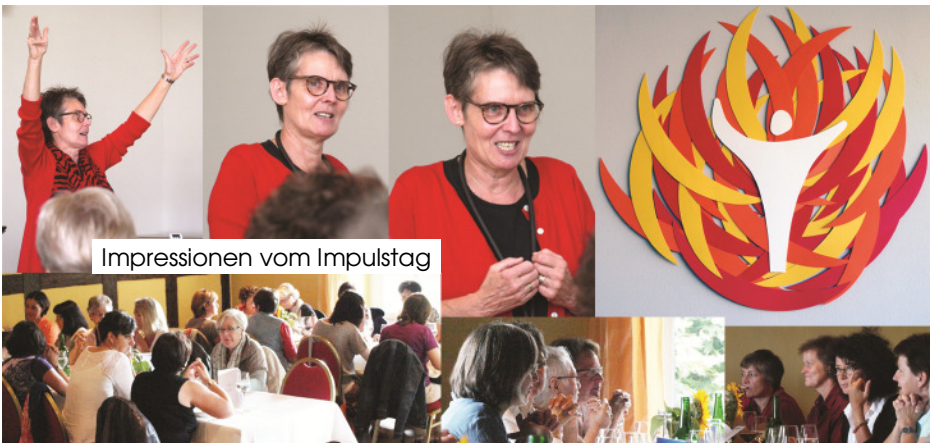
Impressionen vom Impulstag